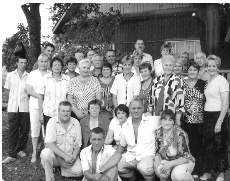
Удзельнікі з'езда аднавяскоўцаў (в. Паддуб'е, жнівень 2010 г.)

Нягледзячы на цяжкі побыт, паводле ўспамінаў старых вяскоўцаў, жылі яны пасля вайны дружна: былі спагадлівымі, падзельчывымі, пры магчымасці збіраліся разам. Моладзь у хатах ладзіла вечарыны. Былі свае вастрасловы і жартаўнікі, танцавалі пад гар-