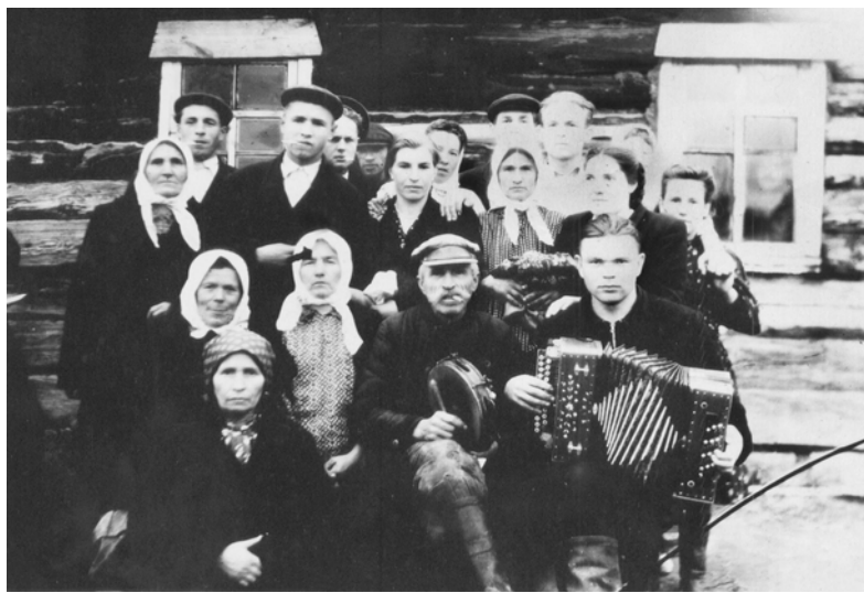
Вясёлы ў Паддуб'і (1952 г.)