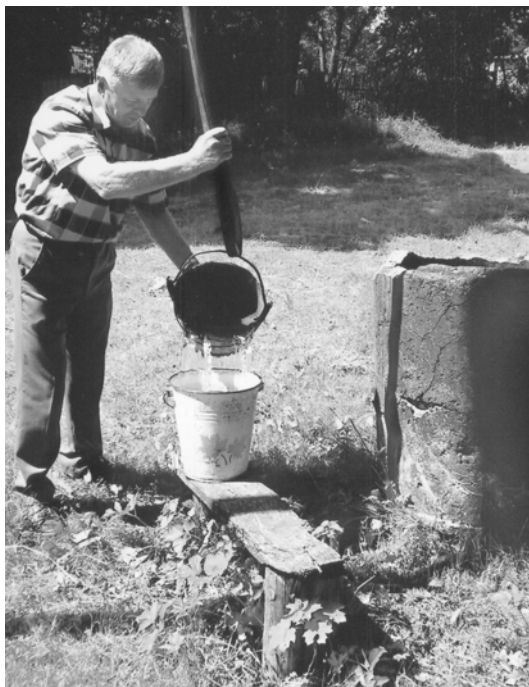
Аўтар каля калодзежа

Разам з калектывізацыяй па ўсіх навакольных паселішчах прайшла хваля раскулачвання і высялення «ворагаў народа». Так сем'і Тукоцкіх, Апрадзевых, Сіўцовых, Мацаковых, Ракавых разам з сем'ямі іншых праца-